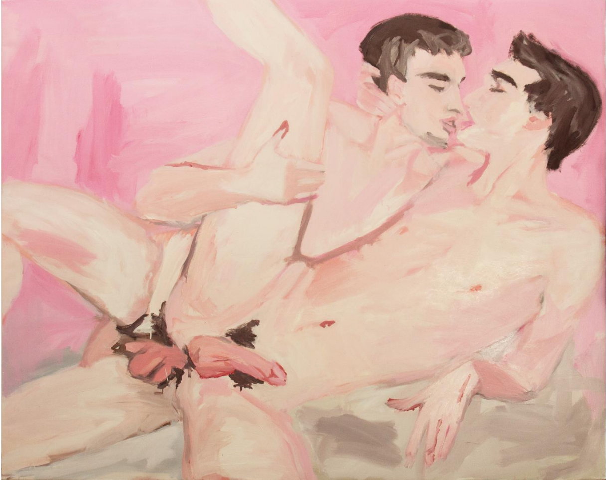
41. ábra Dallos Ádám: Cím nélkül, 2010, olaj, vászon, 160x200 cm