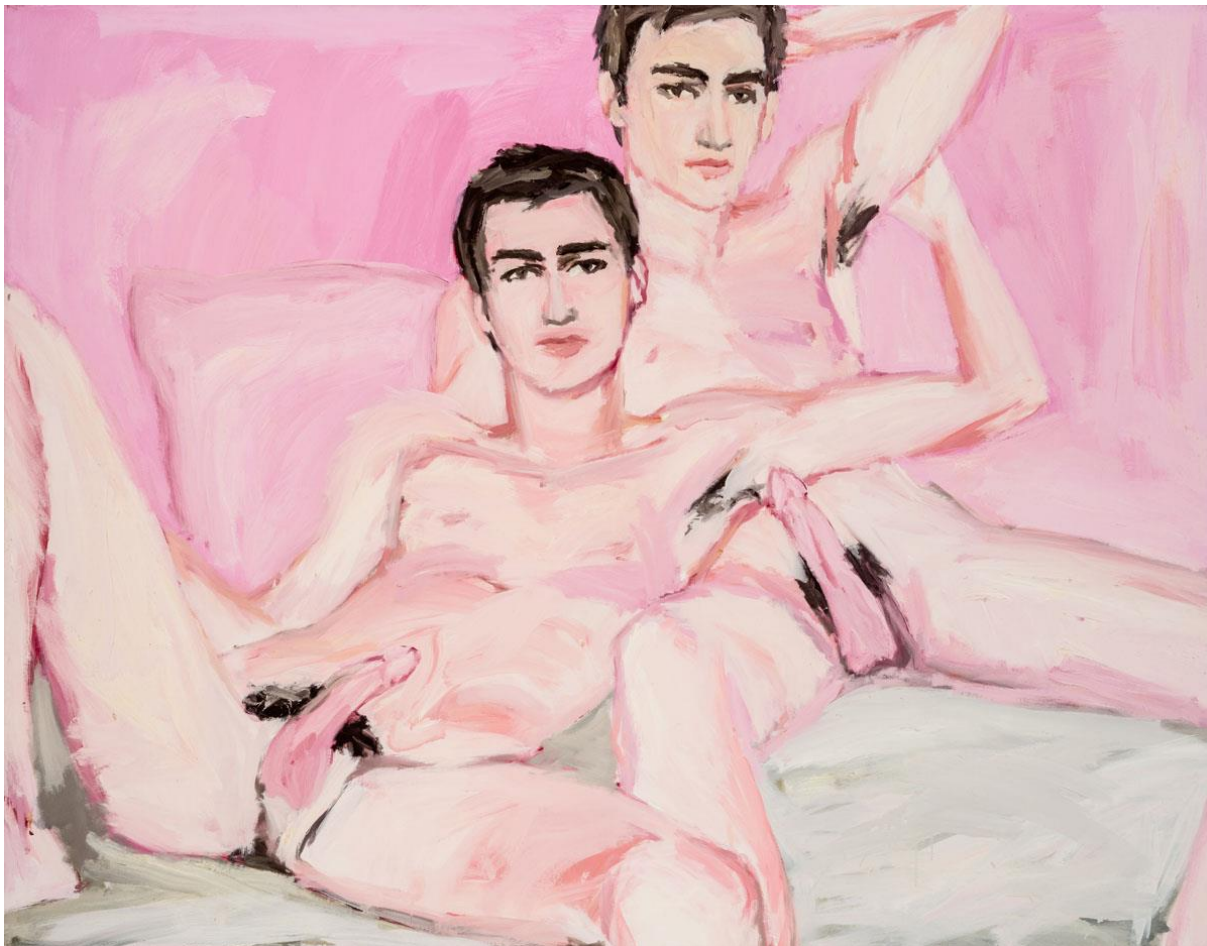
43. ábra Dallos Ádám: Cím nélkül, 2010, 160x200cm, olaj, vászon