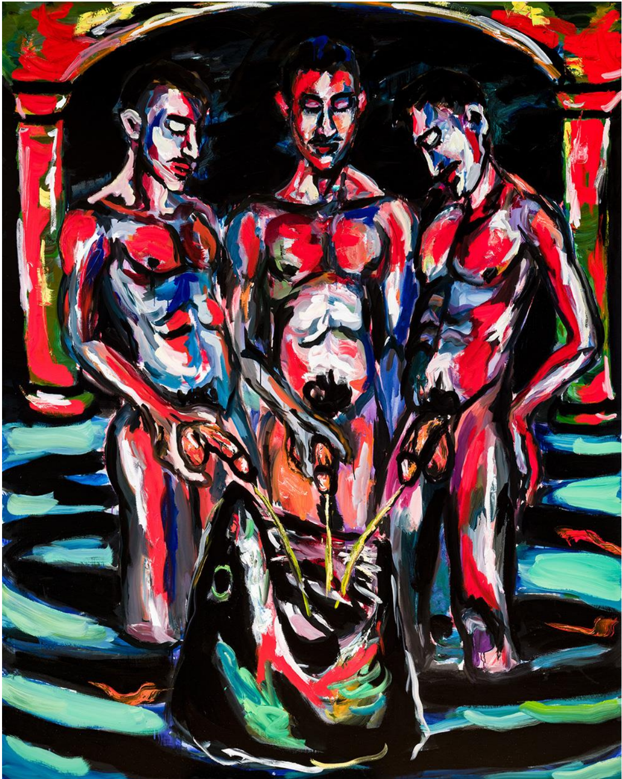
47. ábra Dallos Ádám: Urinating into the Mouth of a Shark (Rudas Series) 200x160cm, olaj, vászon