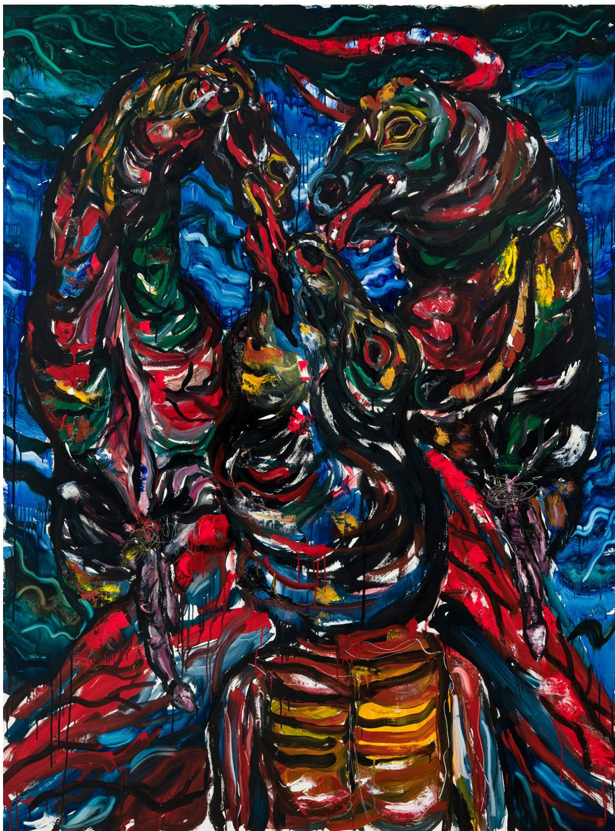
45. ábra Dallos Ádám: Bulls Licking Each Other's Face, 2020, 200x150cm, olaj, vászon