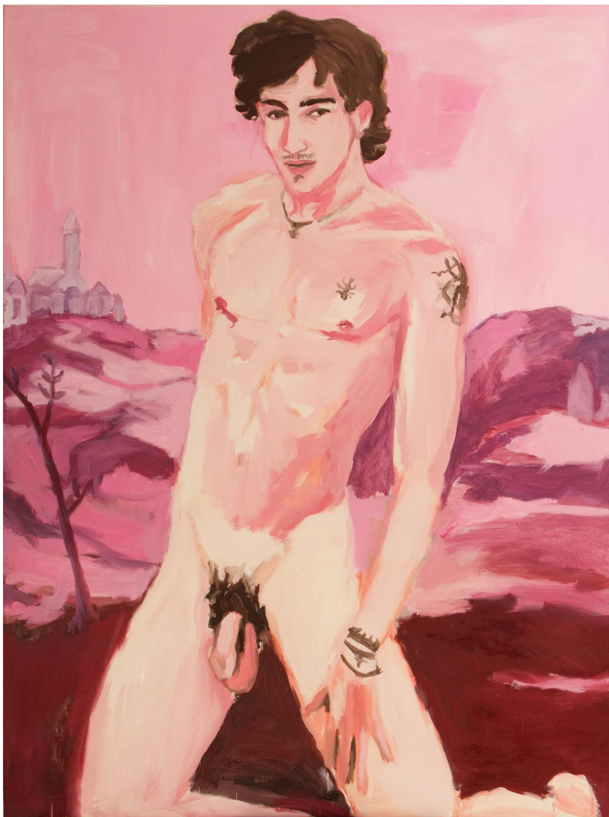
42. ábra Dallos Ádám: Cím nélkül, 2010, olaj, vászon, 200x160cm magángyűjtemény