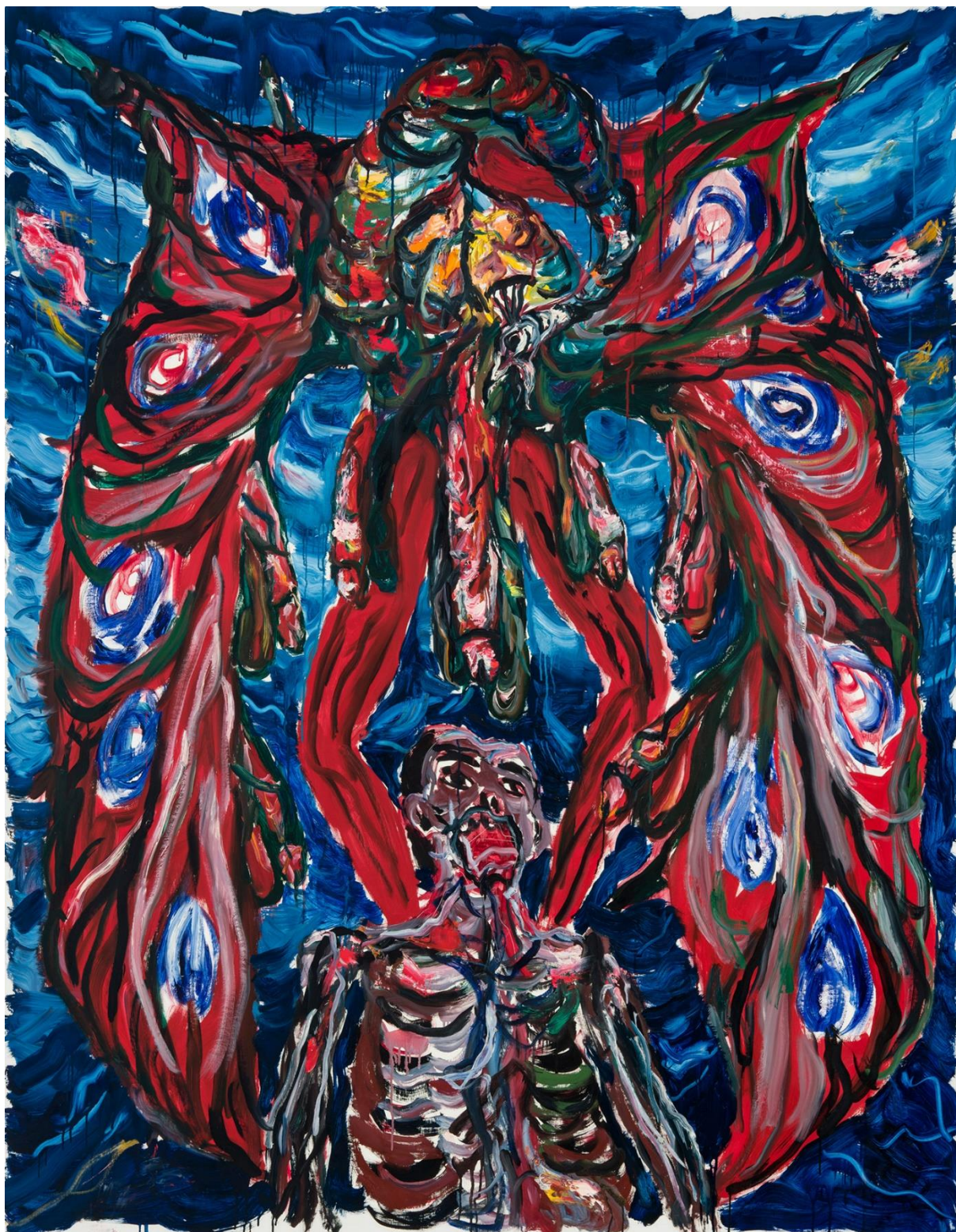
44. ábra Dallos Ádám: Penises growing on peacock's wings, 150x190cm, olaj, vászon 2020, fotó: Áment Gellért