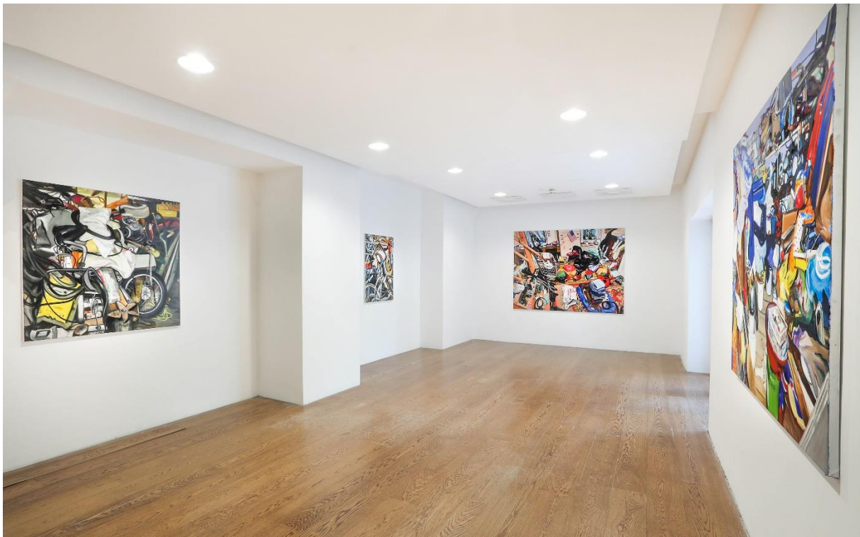
3. kép: Kiállítás enteriőr, Zékány Dia: Az én szívemben boldogok a tárgyak , Q Contemporary, Project Space, Budapest, 2022