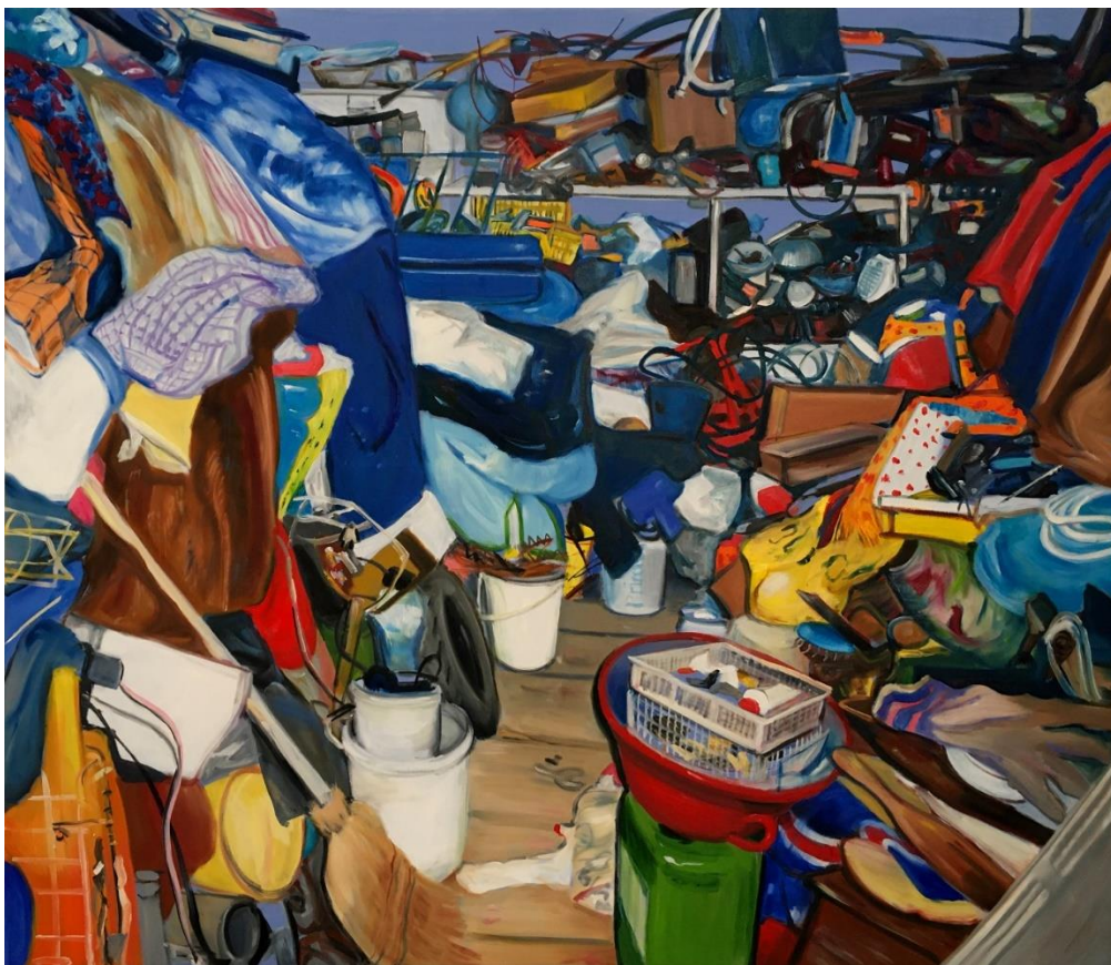
6. kép: Zékány Dia, Collection 4 , 2022, 130x150 cm, olaj, vászon