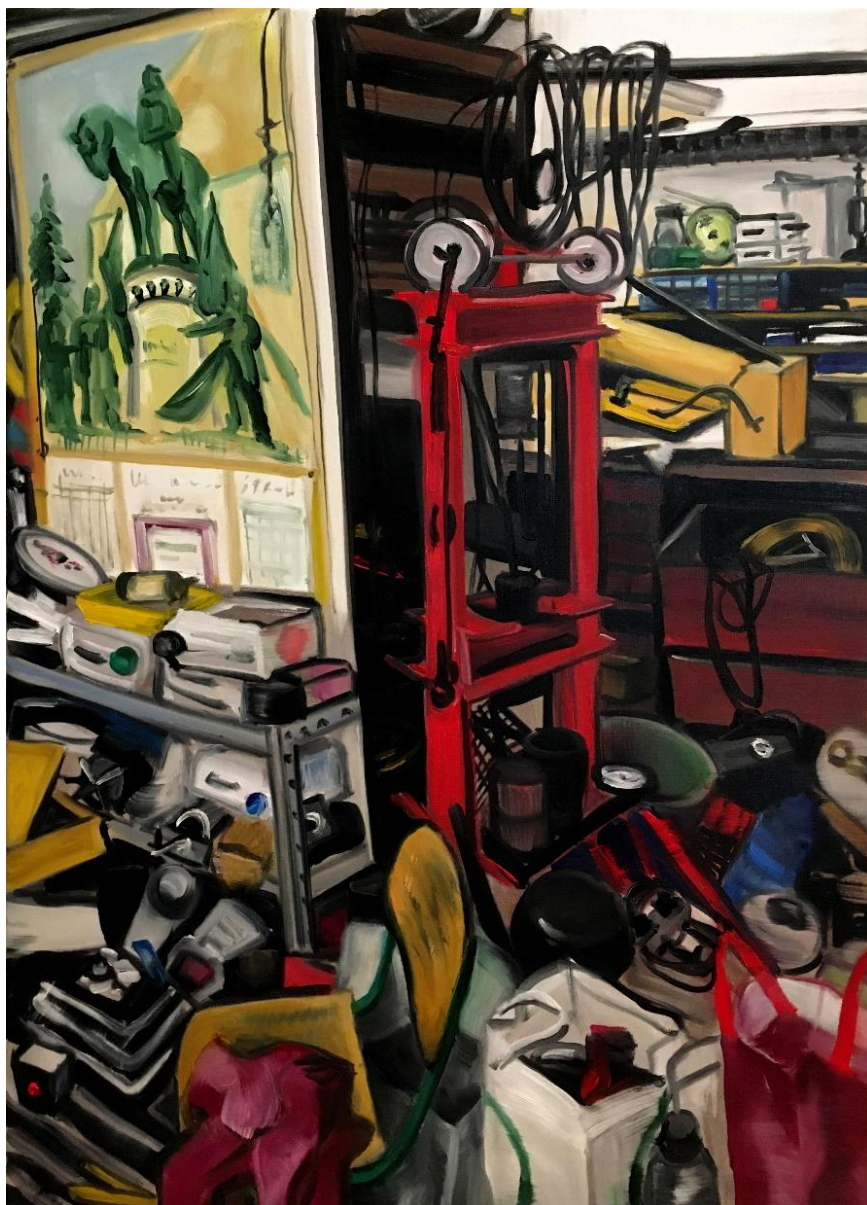
8. kép: Zékány Dia, Collection 5 , 2022, 90x65 cm, olaj, vászon

A Collection 5 és a Collection 10 című festmények egy háztartási gépet javító üzlet belső tereit jelenítik meg. Véletlenül találtam rá a Szív utcában (Budapest 6. kerület), és azonnal láttam, hogy az Apukáméhoz hasonló műhely teljesen beleillik a témámba. Ezekkel a képekkel megjelent a munkáimban azoknak a helyszíneknek a feldolgozása is, amelyek az előzetes kutatás, terepfelmérés, kontakt személy keresés, bármiféle egyeztetés nélkül, random módon dokumentálódnak, és kerülnek be a fénykép gyűjteményembe.