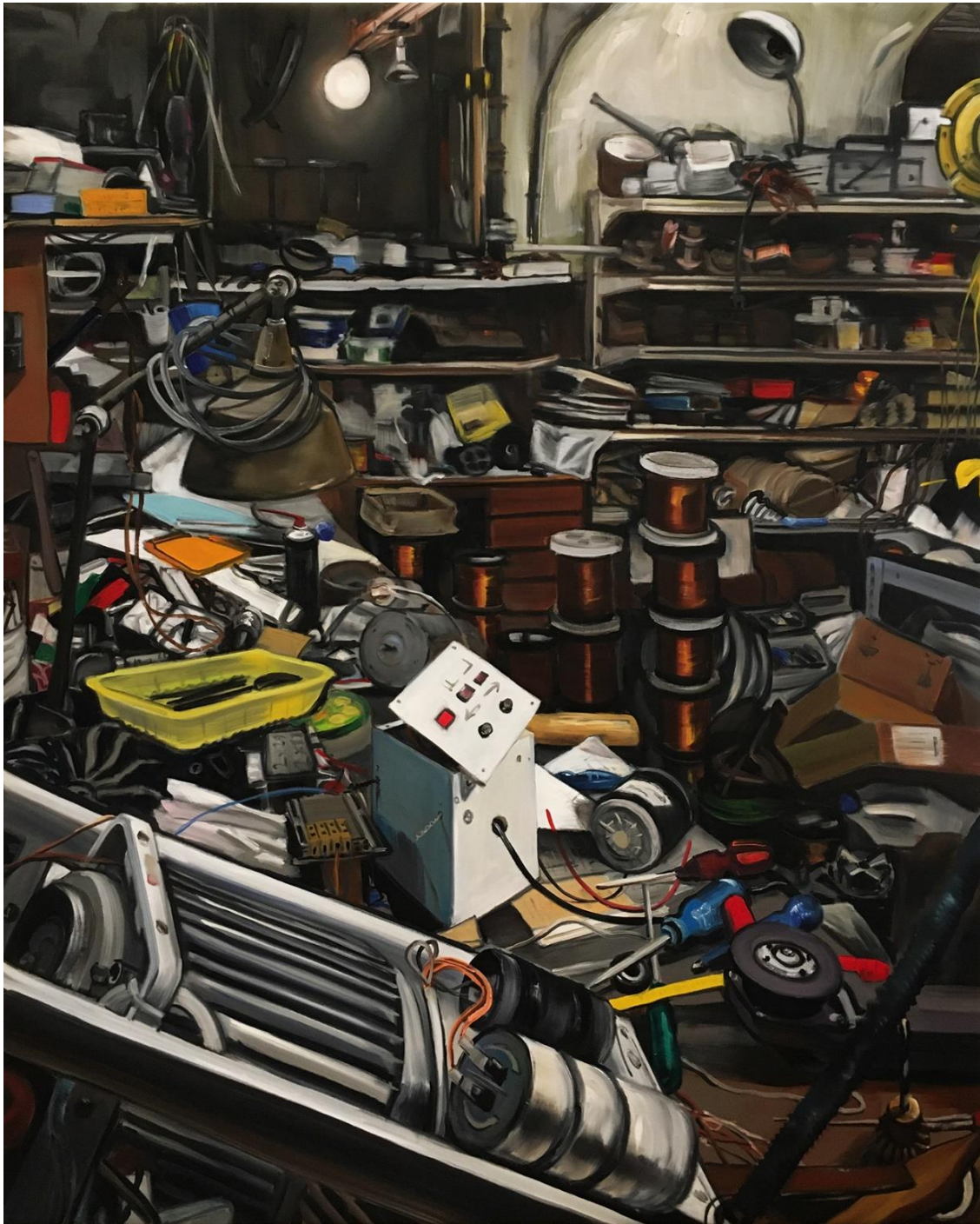
9. kép: Zékány Dia, Collection 10 , 2022, 150x120 cm, olaj, vászon

Művészeti tevékenységemre hatással voltak az enteriőrbrázolás, a polgári miliő megjelenítésének klasszikus mesterei: Matisse, Bonnard, Vuillard, és a 17. századi holland zsánerkép festészet nagyjai: Adriaen van Ostade, Hendrick Avercamp, Jan Vermeer. A jelenkori művészeti referenciáknak egy egész fejezetet szenteltem „Kortárs művészeti párhuzamok” címen.