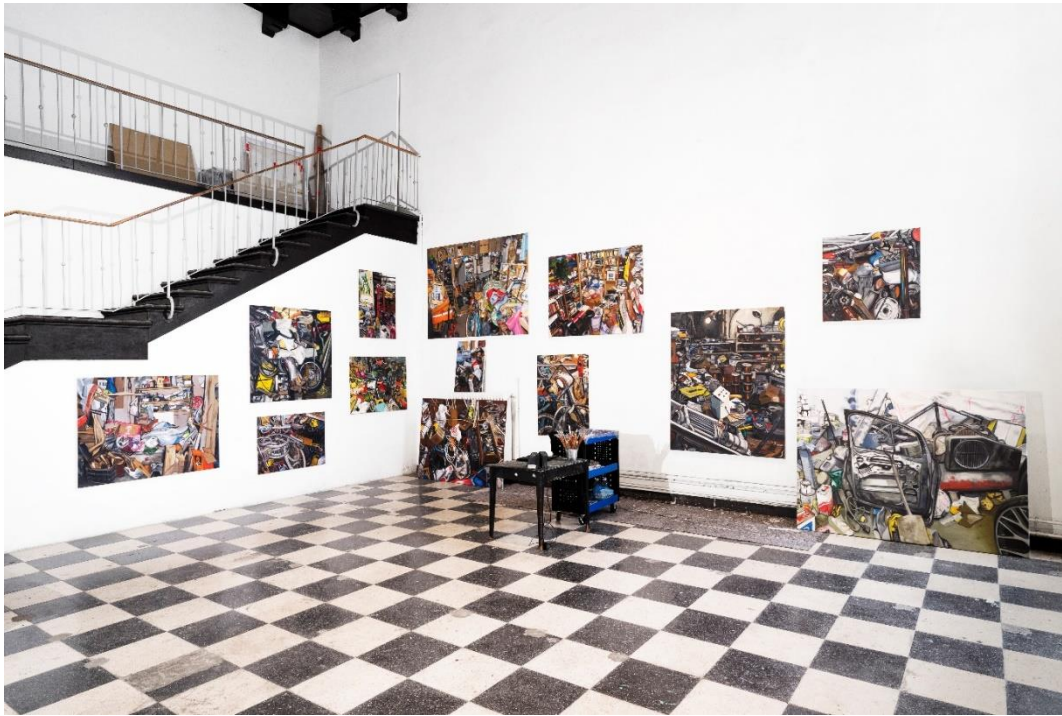
4. kép: Műterem enteriőrjének részlete, MKE Doktori Iskola, Feszty-ház, Budapest, 2022