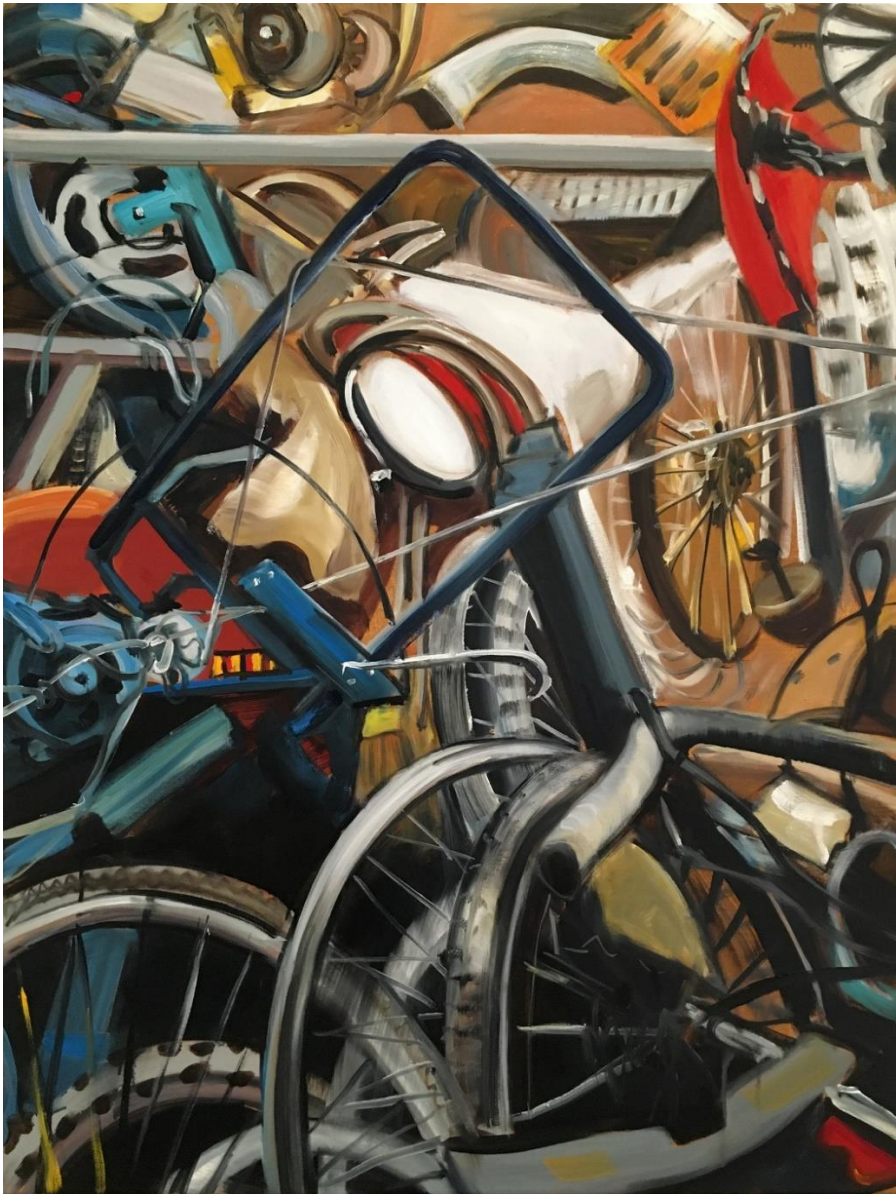
5. kép: Zékány Dia, Collection 2 , 2021, 75x100 cm, olaj, vászon