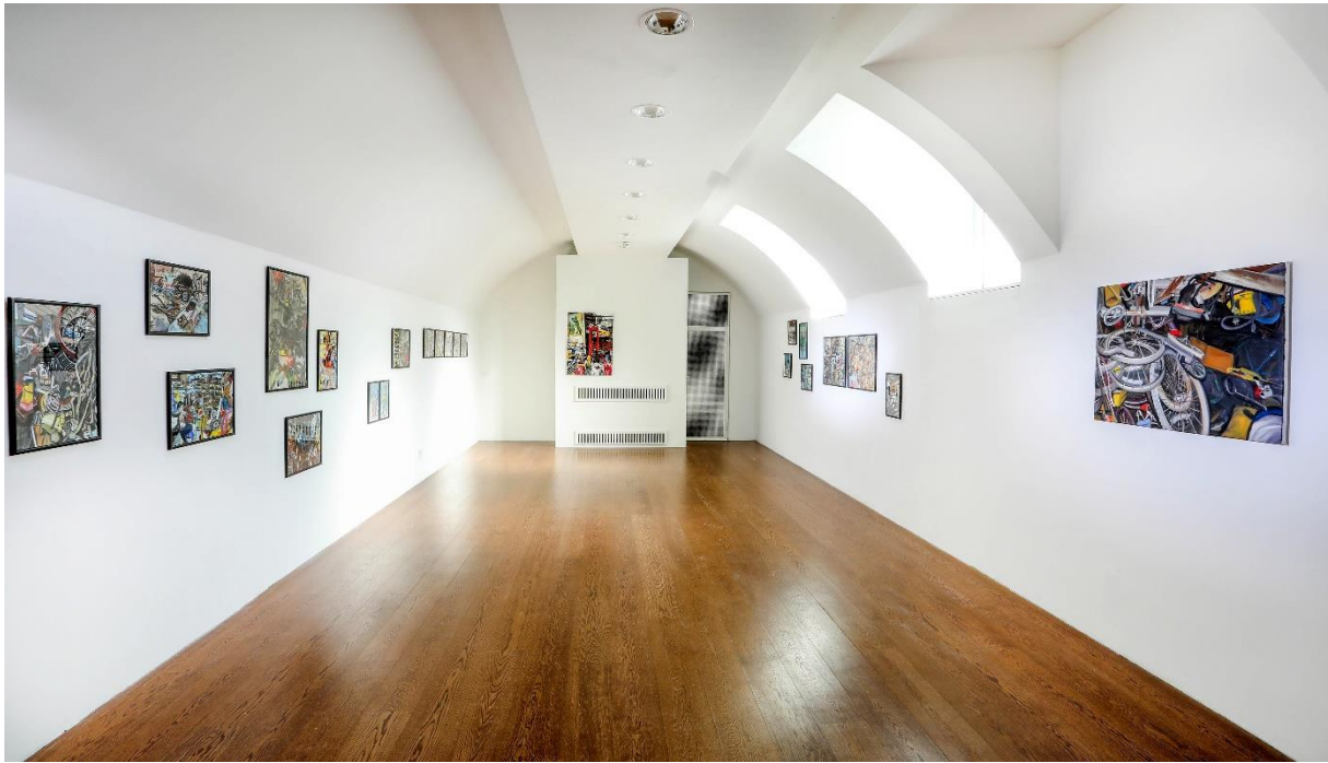
2. kép: Kiállítás enteriőr, Zékány Dia: Az én szívemben boldogok a tárgyak , Q Contemporary, Project Space, Budapest, 2022, kép forrása: Mányó Ádám