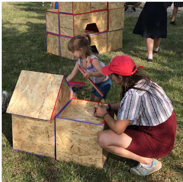
Fotók a frissen elkészült installációról, Építész Szakkolégium „Repeta” tábora. Ászár, 2023.