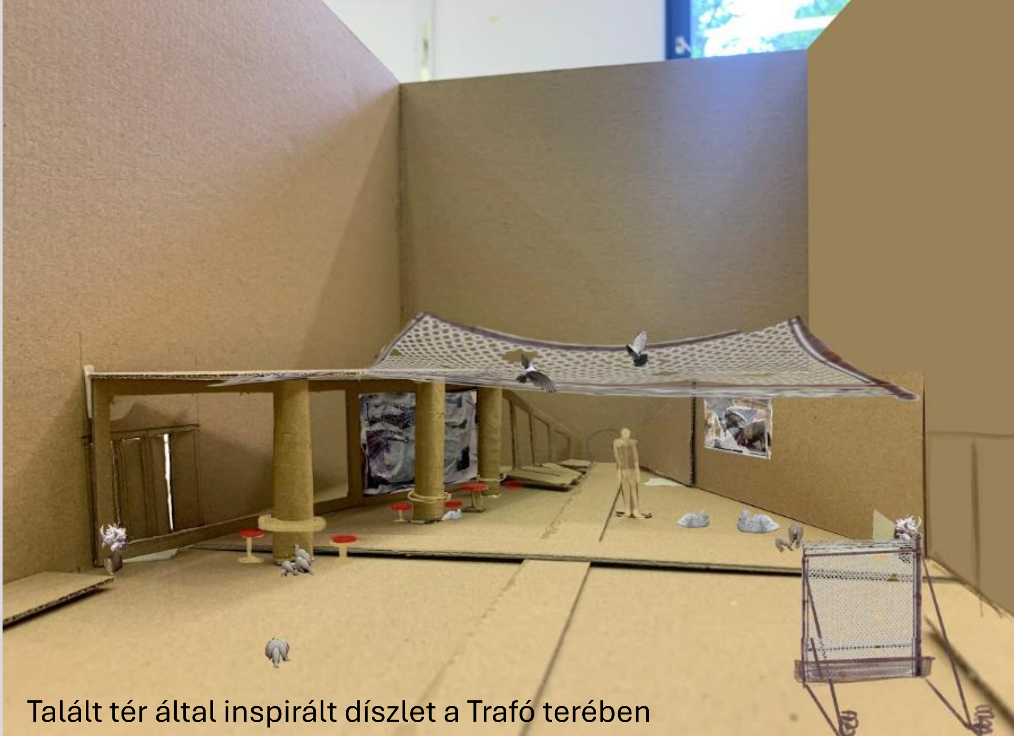
Talált tér által inspirált díszlet a Trafó terében