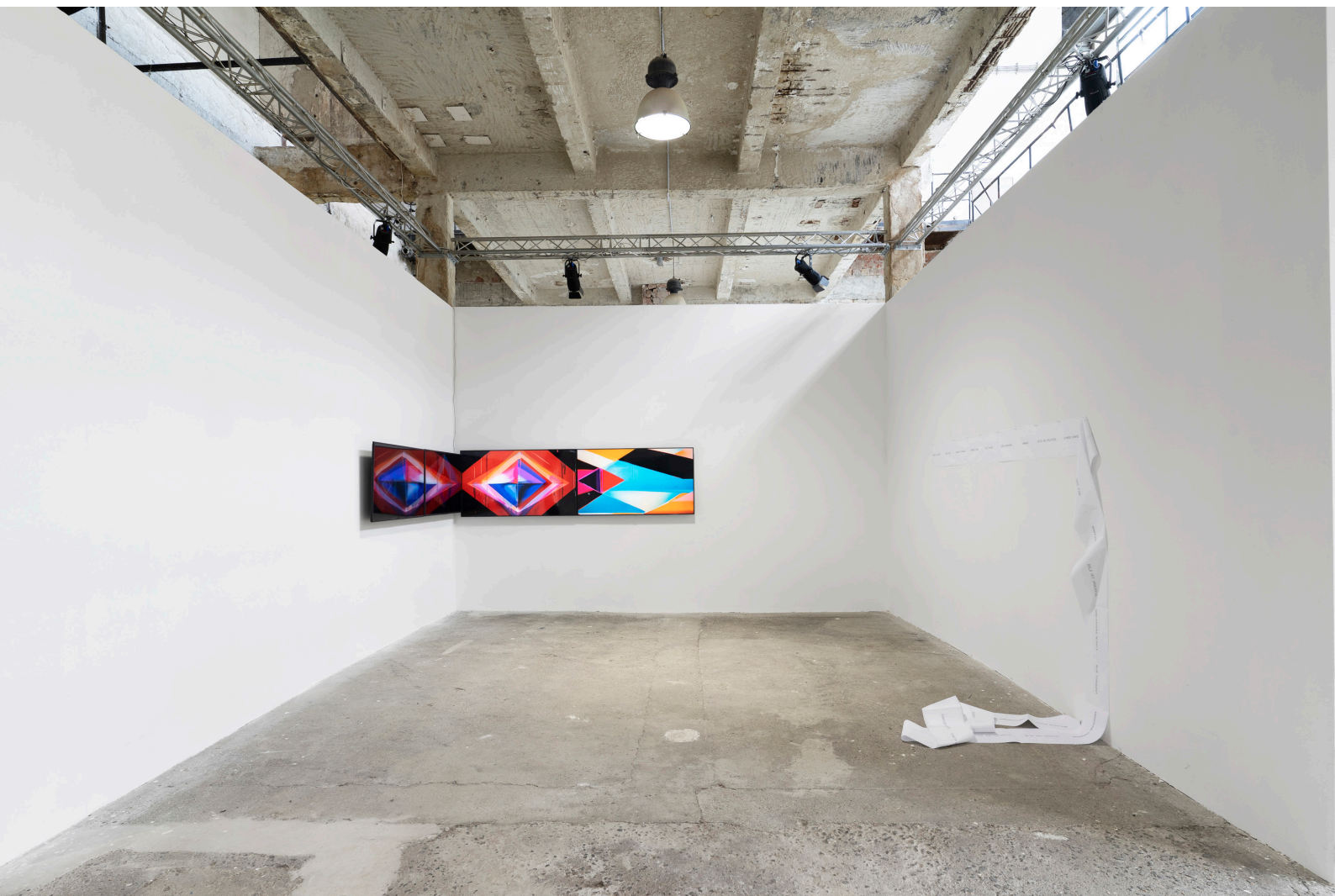
Machine Impressions, négycsatornás videóinstalláció, C-print papíron, 4min, loop, 2023, Torula Művészter, Győr 2023