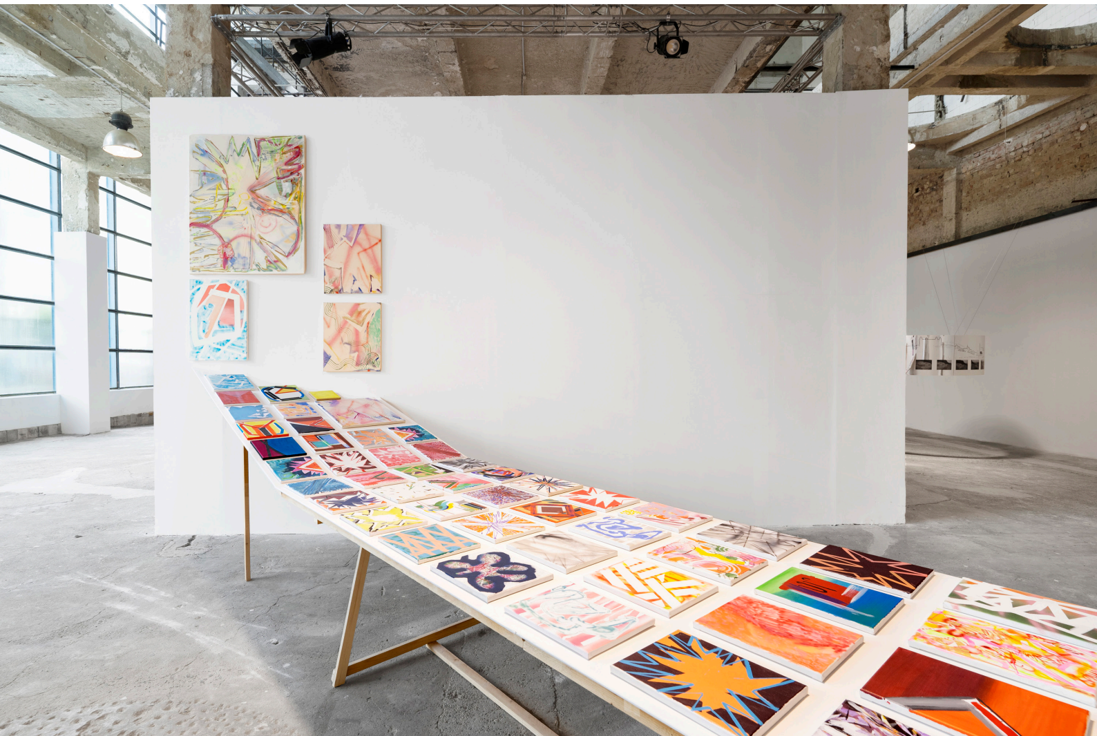
Shifting River, fa, gipszkarton, 75 festmény (akril, olaj vásznon) Torula Művészter, Győr 2023