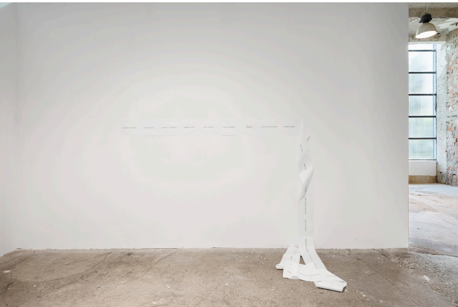
Machine Impressions, C-print papíron, 2023, Torula Művészter, Győr 2023