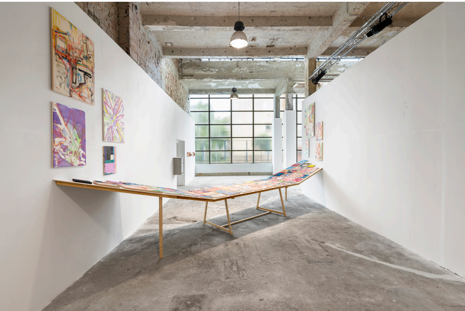
Shifting River, fa, gipszkarton, 75 festmény (akril, olaj vásznon) Torula Művészter, Győr 2023