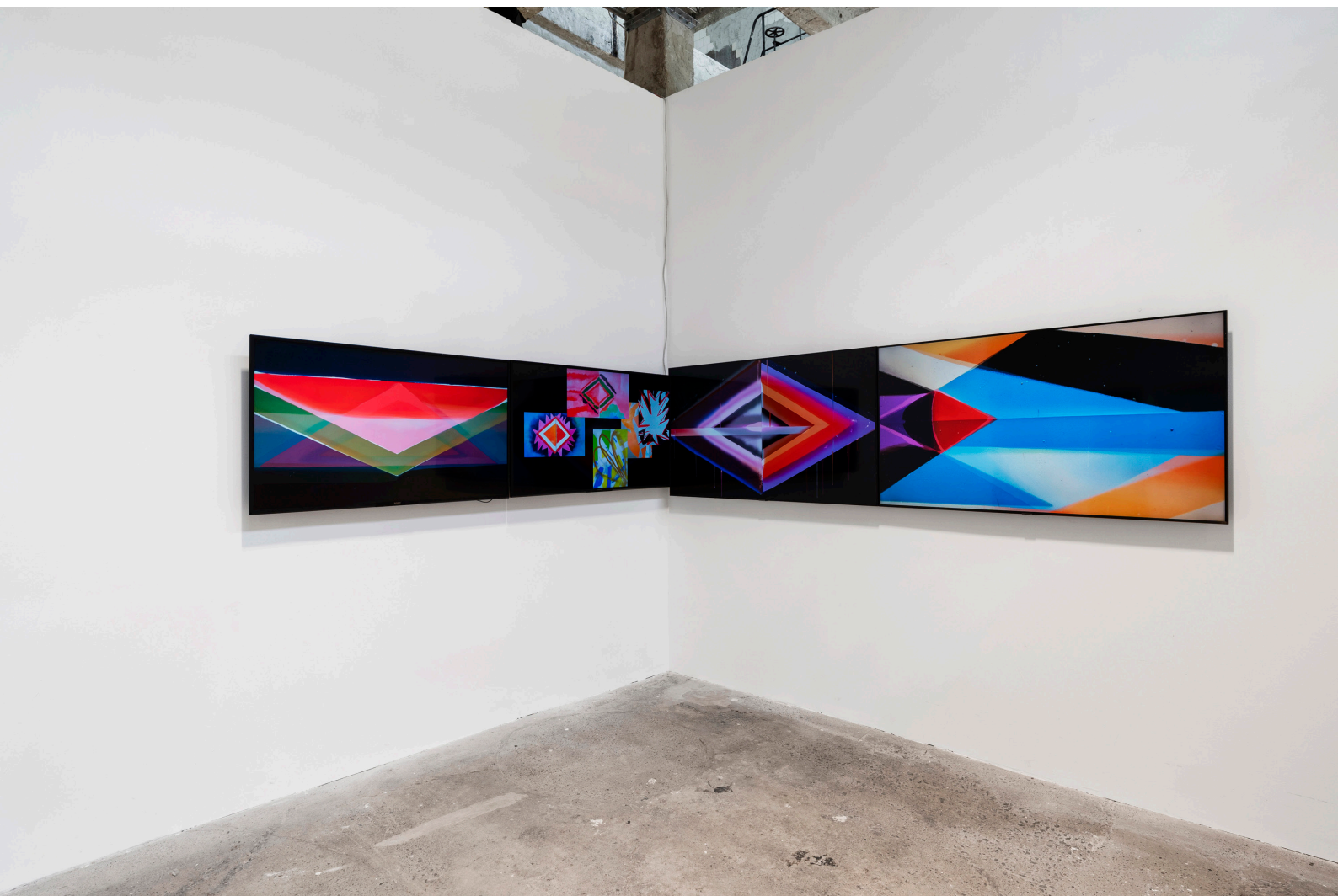
Machine Impressions, négycsatornás videóinstalláció, 4min, loop, 2023, Torula Művészter, Győr 2023