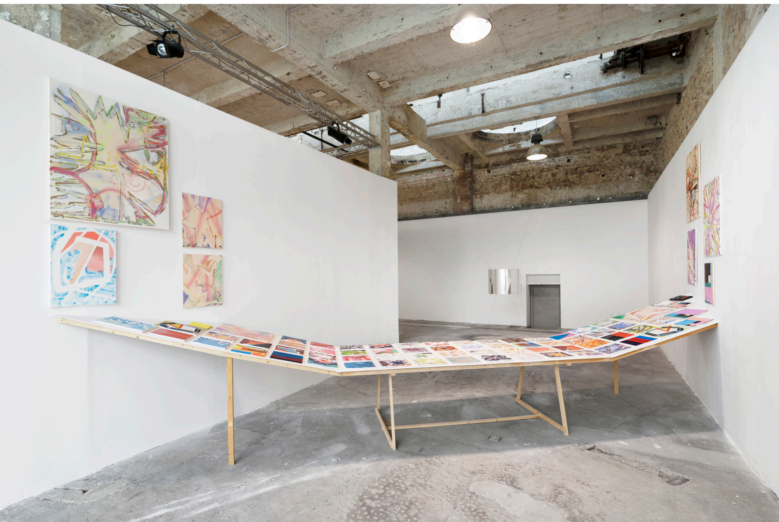
Shifting River, fa, gipszkarton, 75 festmény (akril, olaj vásznon) Torula Művészter, Győr 2023