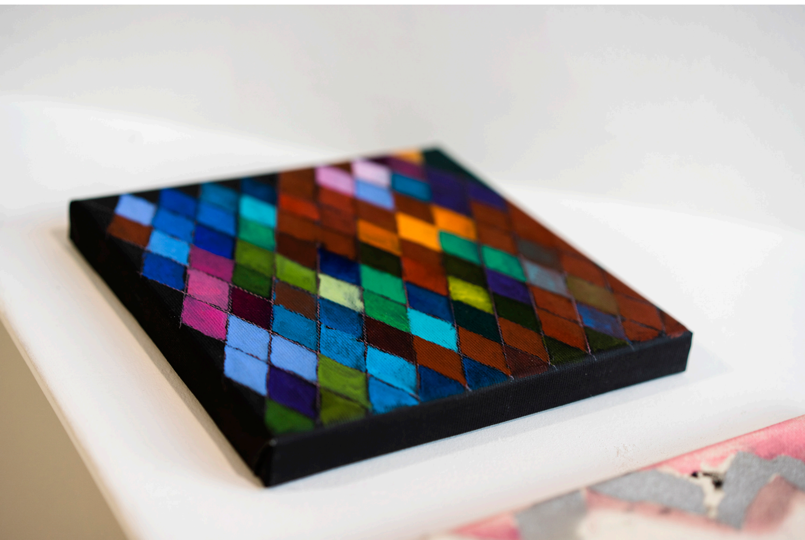
Harlekin, 20 x 20 cm (olaj vásznon) Torula Művészter, Győr 2023