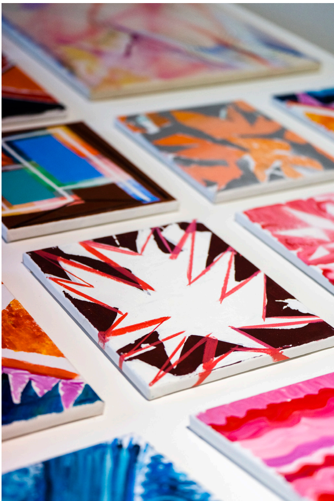
Shifting River, fa, gipszkarton, 75 festmény (akril, olaj vásznon) Torula Művészter, Győr 2023