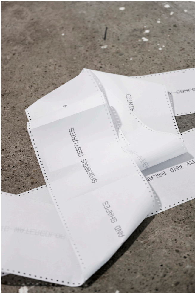
Machine Impressions, C-print papíron, 2023, Torula Művészter, Győr 2023